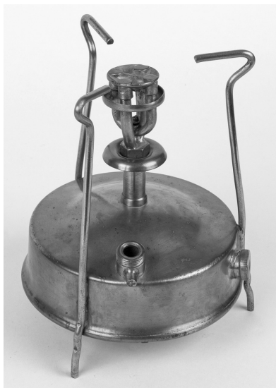
Примус (1930–1939 гг.). КГМ 620

Здесь можно разместить и книжный шкаф со стеклянными дверцами – для демонстрации не только книг, но и подлинных фондовых предметов, стулья – венские или другие (используются в том числе и для посетителя), полки, этажерка, кресло, зеркало, комод с выдвигаемыми ящиками (рекомендуется открывать) и телефонным аппаратом, ширма, абажур над столом... В окружении таких вещей, да ещё и в отдельной квартире, в то время мог проживать чиновник высокого ранга – представитель партийно-хозяйственной номенклатуры вместе с семьей.