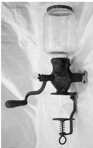
Кофемолка настенная. КГМ 31103

В «Старой квартире» может прожить семья американского финна – инженера, техника, словом, представителя технической интеллигенции. Трудно переоценить вклад в развитие промышленности республики, сделанный североамериканскими