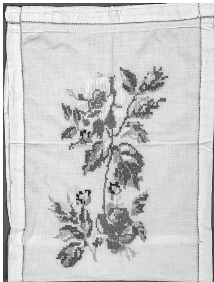
Газетница. КГМ 49884